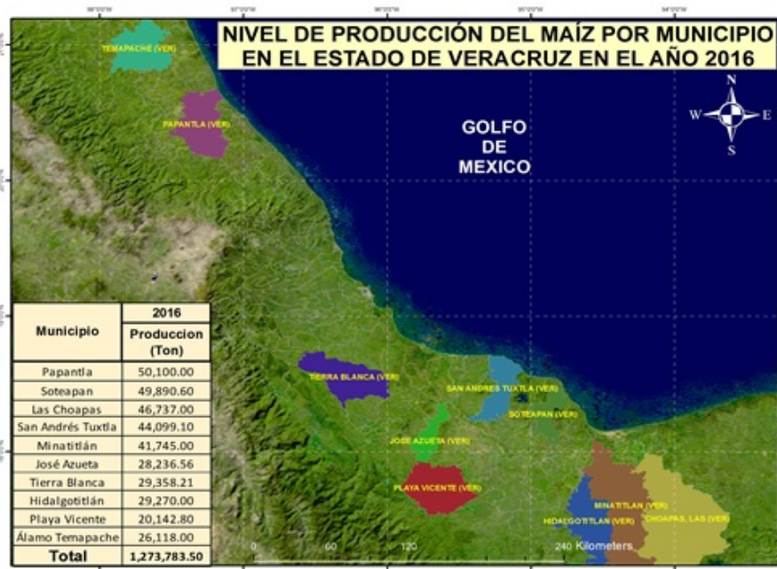
FIGURA 3 Mapa productivo de maíz en Veracruz 2016

En lo que se refiere al año 2016, los principales productores fueron: Papantla, Soteapan y las Choapas (tabla 1 y figura 3). Podemos observar en la figura 3, el municipio de Papantla ubicado en el norte, y al sur del estado los municipios de Soteapan y Las Choapas con una producción de 50,100.00, 49,890.60 y 46,737.00 toneladas respectivamente, en este año con respecto al 2015, se tuvo un aumento en la producción de maíz a 61,694.17 toneladas y un aumento en el valor económico de la producción de $251,584.73 pesos (Servicio de Información Agroalimentaria y Pesquera, 2016), esto es debido a dos factores económicos importantes: se presentó un aumento en el precio internacional del maíz que se establece para todo el mundo en dólares en la Bolsa de Futuros de Chicago (CBOT) [1] además hubo una fuerte depreciación del peso frente al dólar.