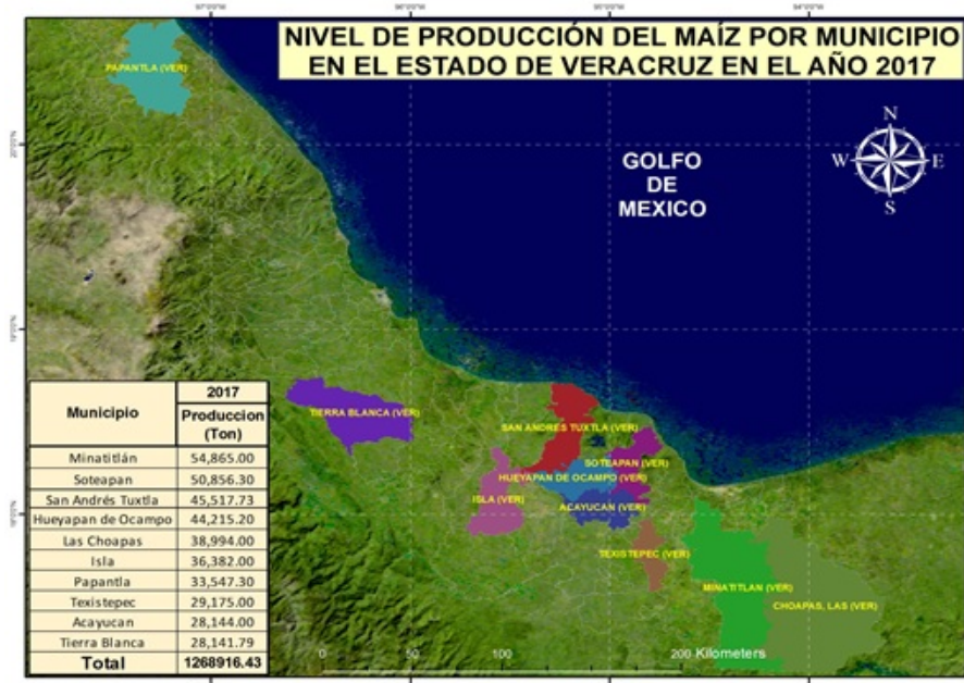
FIGURA 4 Mapa productivo de maíz en Veracruz 2017

elaboración propia con datos del Servicio de Información Agroalimentaria y Pesquera, (2017) y el procesamiento en el software QGIS.