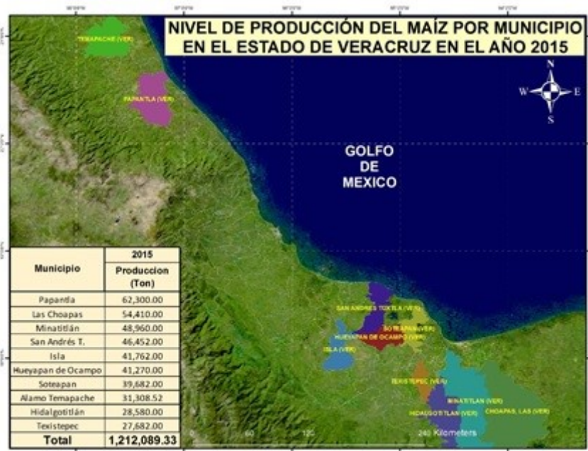
FIGURA 2 Mapa productivo de maíz en Veracruz 2015

Con respecto al año 2015, Papantla, Las Choapas y Minatitlán fueron los tres principales productores de (tabla 1 y figura 2). En este año el mapa productivo muestra el municipio de Papantla ubicado al norte, Las Choapas y Minatitlán ubicados al sur donde obtuvieron una producción de 62,300, 54,410 y 48,960 toneladas de maíz respectivamente; en este año con respecto al 2014, hubo un aumento de la producción de + 26,099.06 toneladas de maíz y un aumento del valor económico de la producción de + $60,672.02 pesos (Servicio de Información Agroalimentaria y Pesquera, 2015), esto se debe a que el consumo de maíz ha ido en aumento.